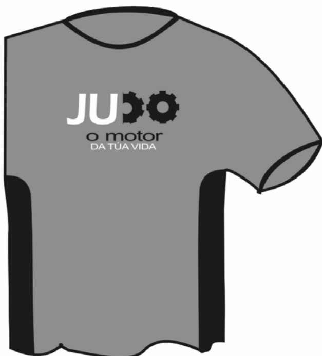
Camisetas difusión e promoción licenzas 2006