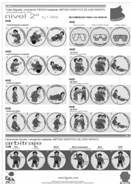
Colección de buhokazos 2006